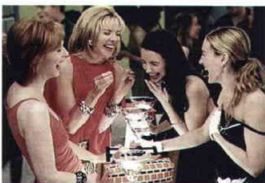
Sex and the City